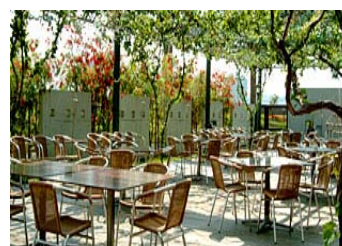
レストラン「はな花」