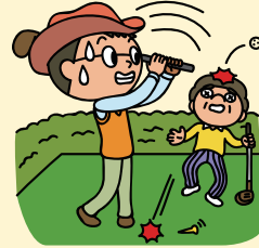
ゴルフのプレー中、打ったボールがあやまって他人に直撃し、ケガをさせてしまった!