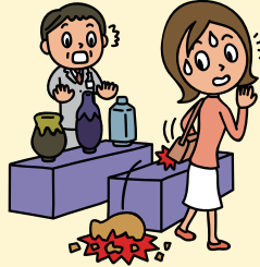
買物中、あやまって商品を落として壊してしまった!