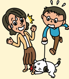
飼い犬が散歩中に、他人に噛みつきケガをさせてしまった!