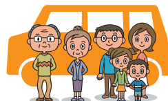
同居の親族 (両親・子供・子供の配偶者)