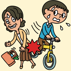
自転車で搭乗中、あやまって他人と接触してケガをさせてしまった!