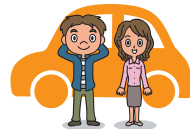
別居の扶養親族 (息子・娘)