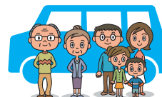
同居の家族 (両親・子供・子供の配偶者)