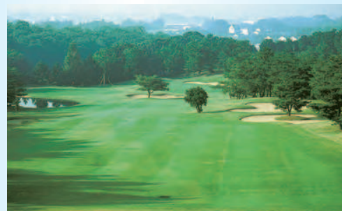
佐賀カントリー倶楽部(15番ホール)