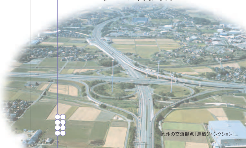
九州の交流拠点「鳥栖ジャンクション」

その他 交通機関の予約、送迎等は申し合わせによりいたしませんのでご了承願います。