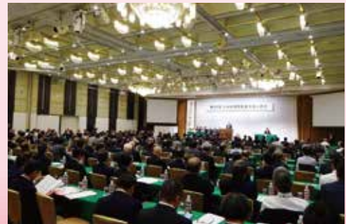
九州経済同友会大会