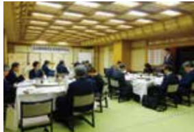
社会・教育委員会

行政・社会問題や教育問題等について研究テーマを設けて活動しています。特に、若者の県外流出が著しい当県の実情を踏まえ、県内で働く意義、郷土愛などを育むキャリア教育に取り組んでいます。