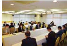
少壮会員交流委員会