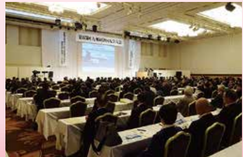
九州経済同友会大会