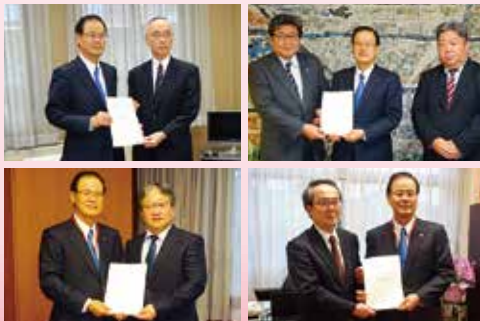
高速道早期整備等要望活動 (財務省・国交省など)