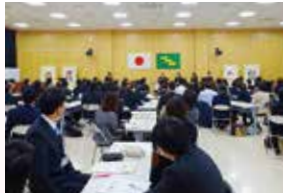
社会・教育委員会 出張授業

行政・社会問題や教育問題等について研究テーマを設けて活動しています。特に、若者の県外流出が著しい当県の実情を踏まえ、県内で働く意義、郷土愛などを育むキャリア教育に取り組んでいます。