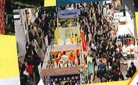
みやざきわた: weeeek!! XSANNOMIYA COLLECTION