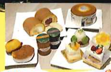
宮崎×神戸 コラボスイーツ