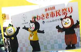
第40回 かわさき市民祭り