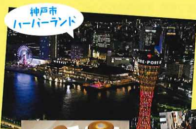
神戸市 ハーバーランド

宮崎県は、川崎市及び神戸市とそれぞれ連携協定を締結しており、互いが持つ資源や特性、強みを活かした連携・交流の取組を実施しています。我が国が本格的な人口減少時代に突入し、地方は大都市への人口集中による深刻な過疎化など様々な課題に直面する中、都市と地方が相互の魅力を活かしながら連携・交流を図ることによる新たな地方創生の可能性について考えます。