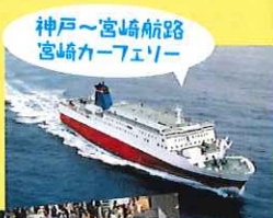
神戸～宮崎航路 宮崎カーフェリー