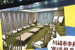
川崎市市長広聴室 宮崎県産材活用